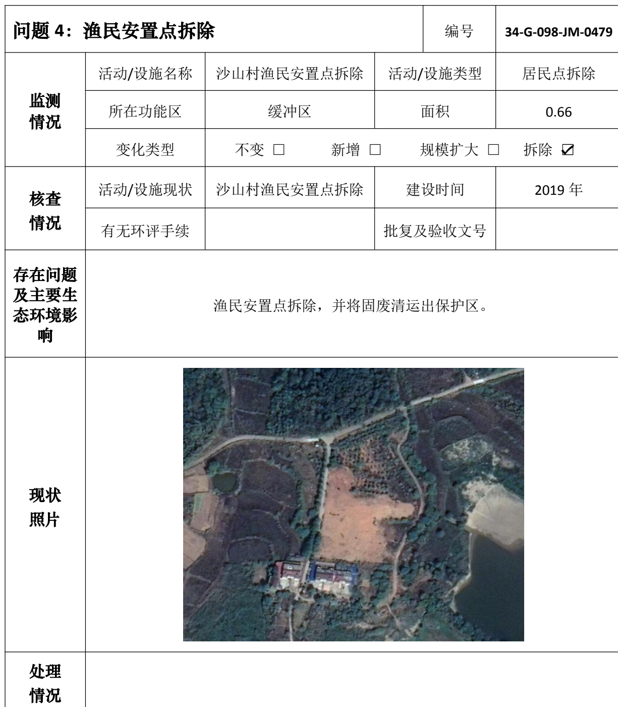
安徽升金湖国家级自然保护区问题核查处理情况表