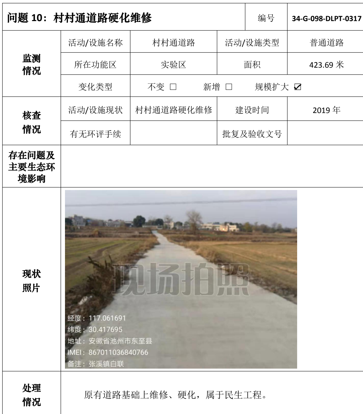
安徽升金湖国家级自然保护区问题核查处理情况表