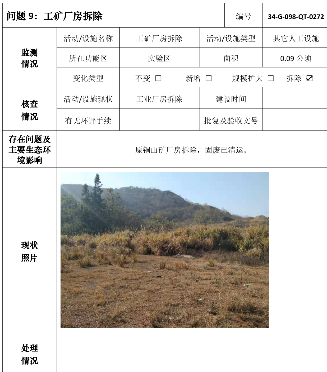
安徽升金湖国家级自然保护区问题核查处理情况表