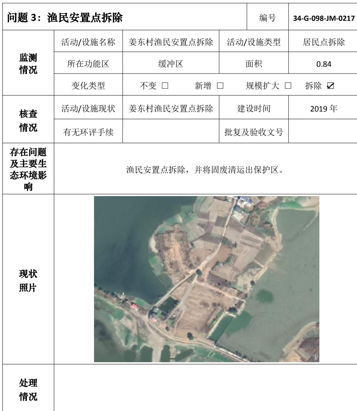
安徽升金湖国家级自然保护区问题核查处理情况表