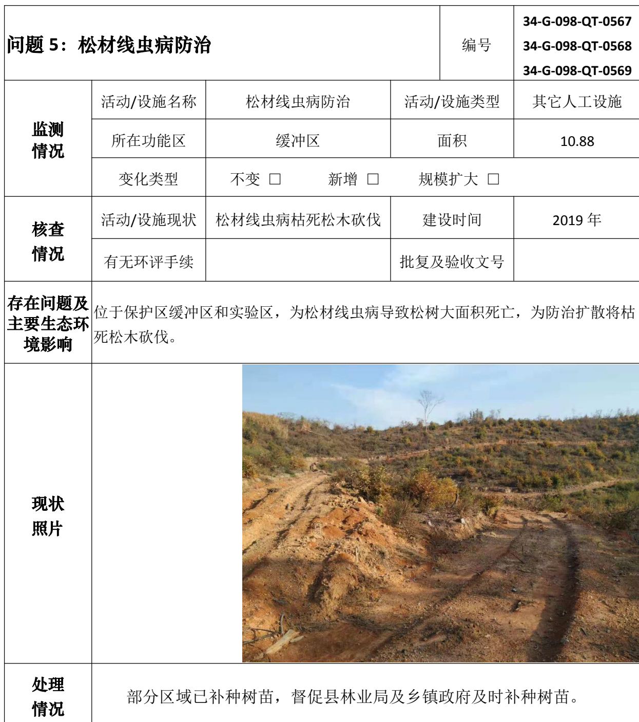
安徽升金湖国家级自然保护区问题核查处理情况表