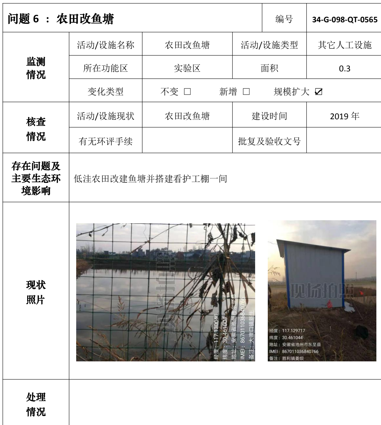
安徽升金湖国家级自然保护区问题核查处理情况表