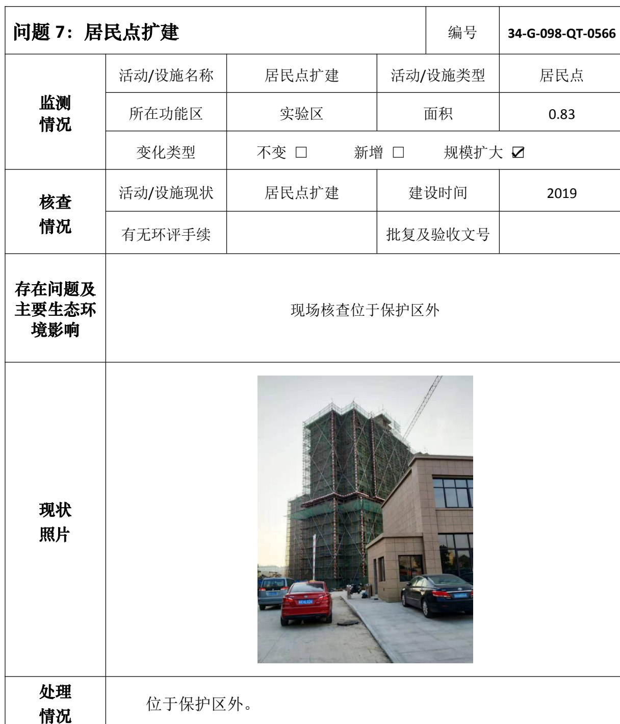
安徽升金湖国家级自然保护区问题核查处理情况表