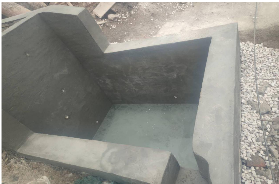
完成一个沉淀池建设