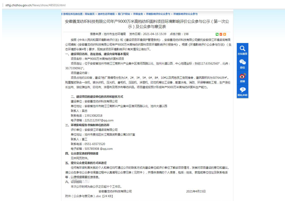
图 2-1 第一次公示截图