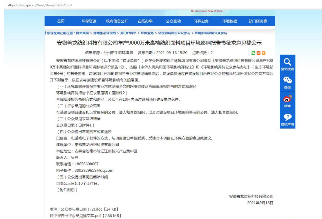
图 3-1 第二次公示截图（网上公示图片）