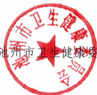
池州市卫生健康委员会