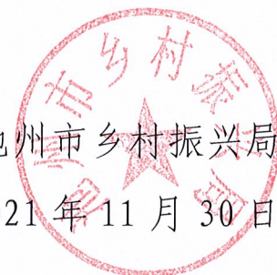
池州市乡村振兴局