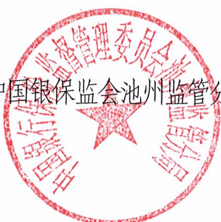
中国银保监会池州监管分局