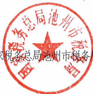
国家税务总局池州市税务局