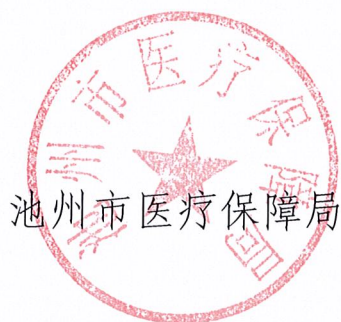
池州市医疗保障局

《池州市巩固拓展医疗保障脱贫攻坚成果有效衔接乡村振兴战略实施方案》已经市政府同意，现印发给你们，请结合实际认真抓好贯彻落实。