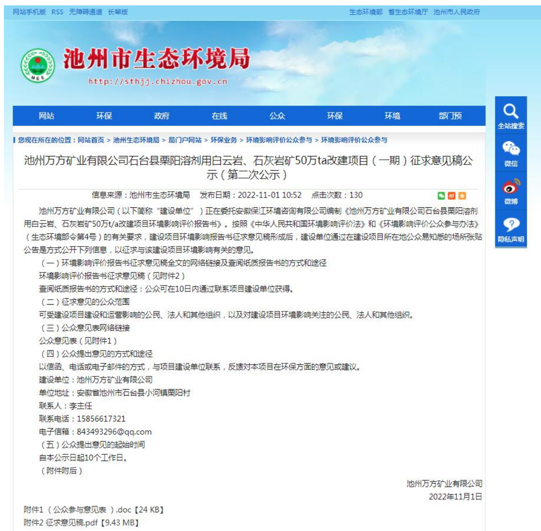
图 3-1 第二次公示截图（网上公示图片）