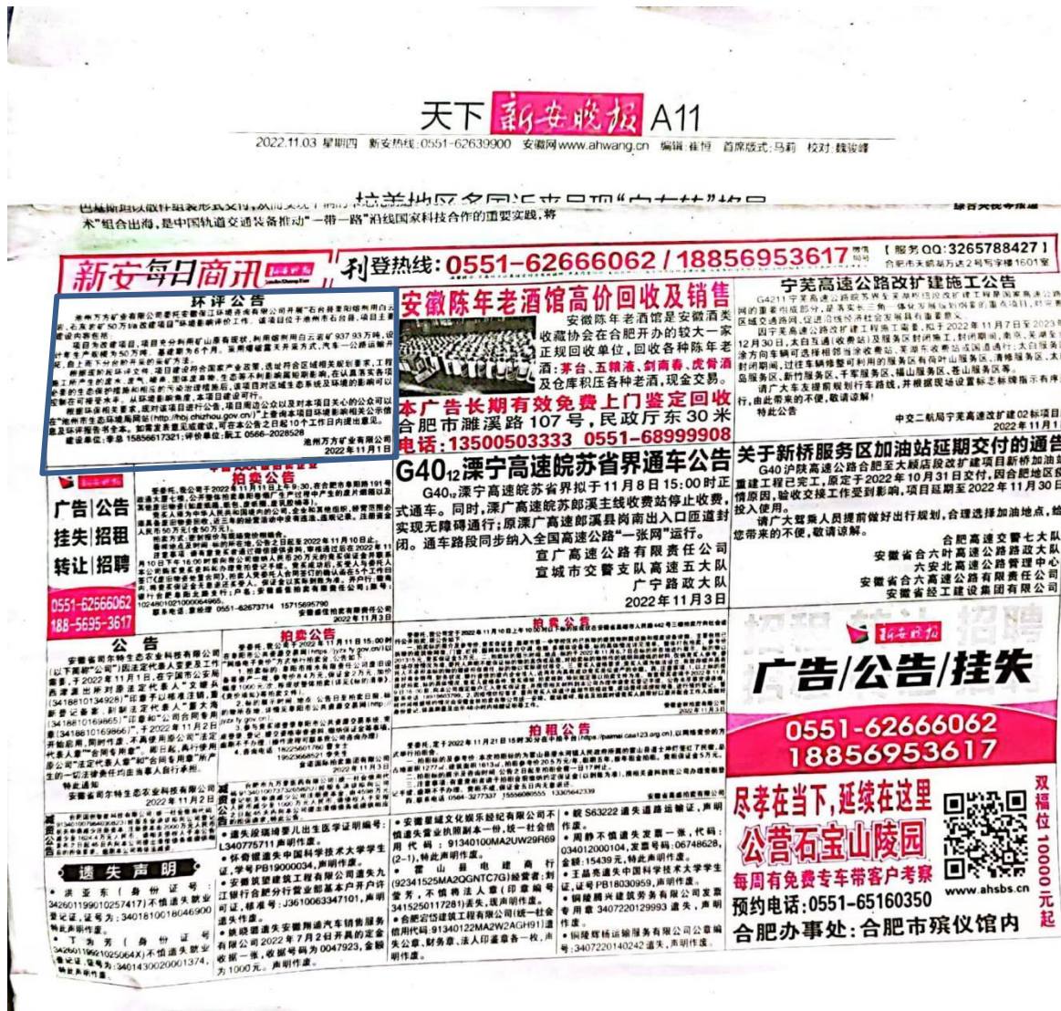
图 3-3 报纸公开照片 (2022-11-3)