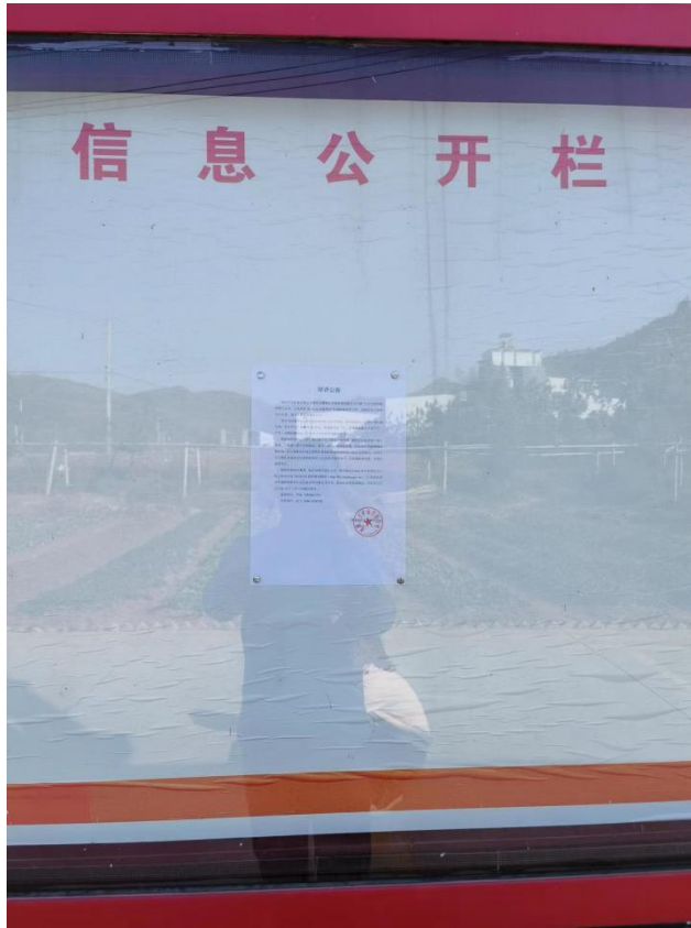
本项目在项目区张贴公告照片