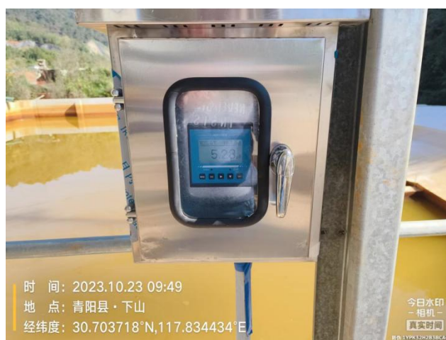
1#沉淀池新增 PH 监测设备