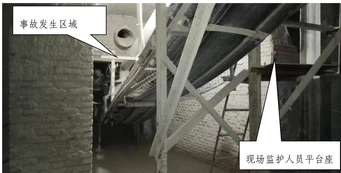
图 3 事故发生在立窑底部出料口处现场图