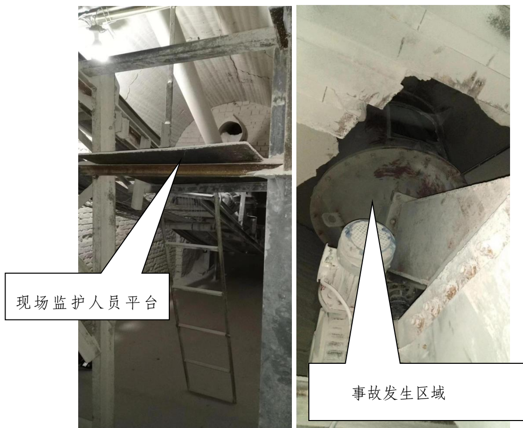
图 2 事故现场图（1#窑底部）