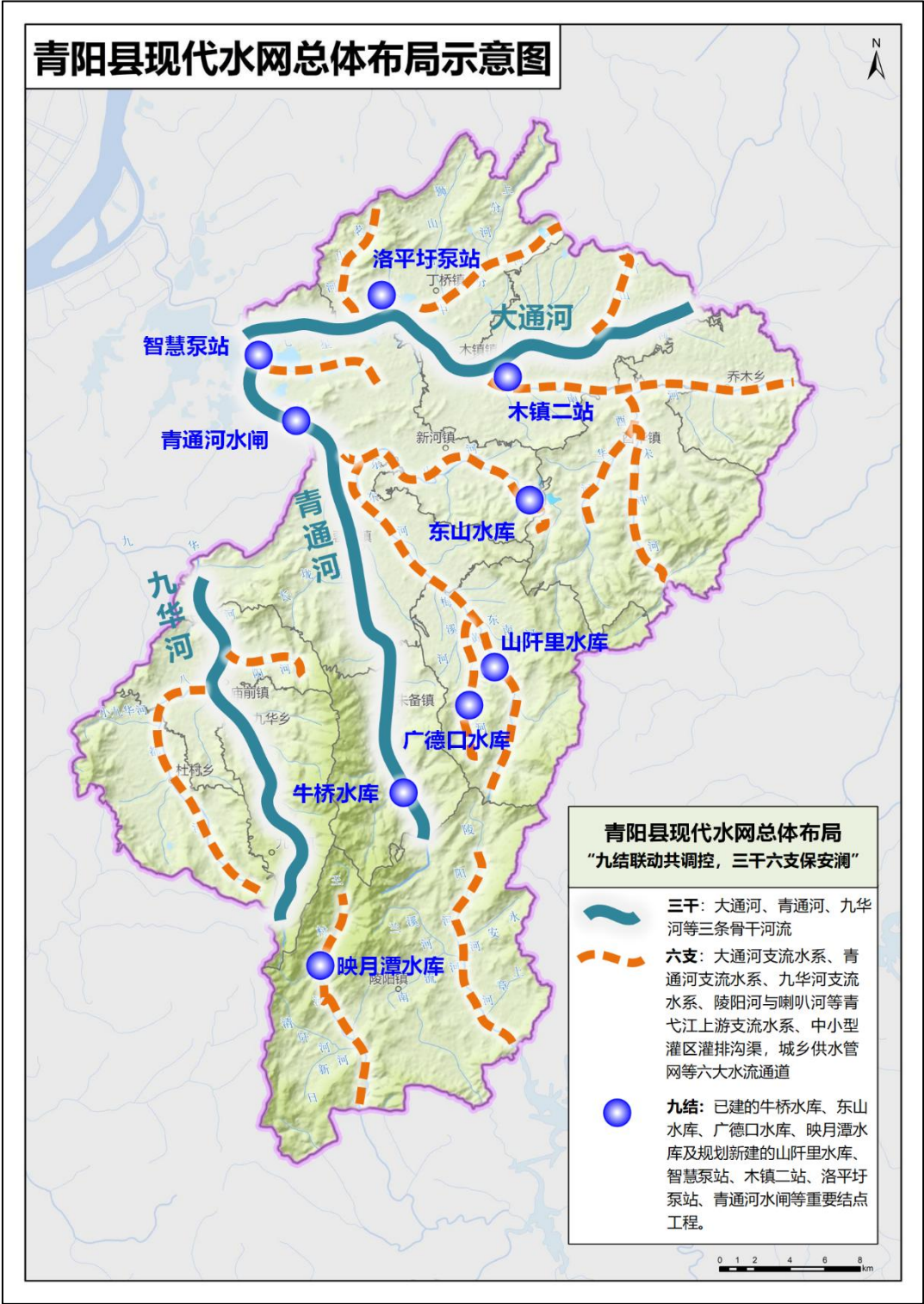
图 2. 4-3 青阳县现代水网总体布局示意图