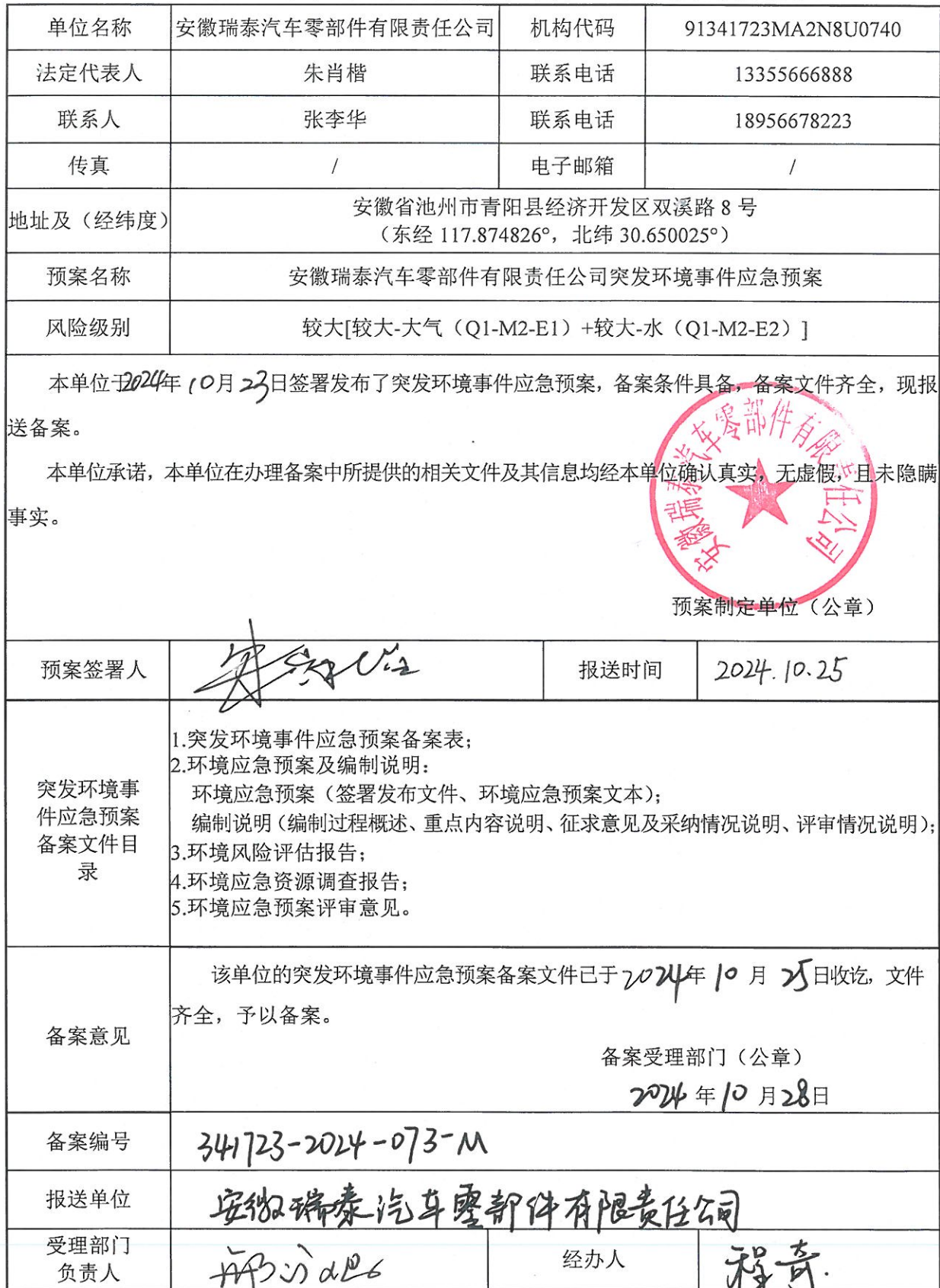
企业事业单位突发环境事件应急预案备案表