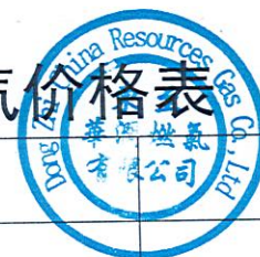
附件3 市（县、区）天然气终端用气价格表