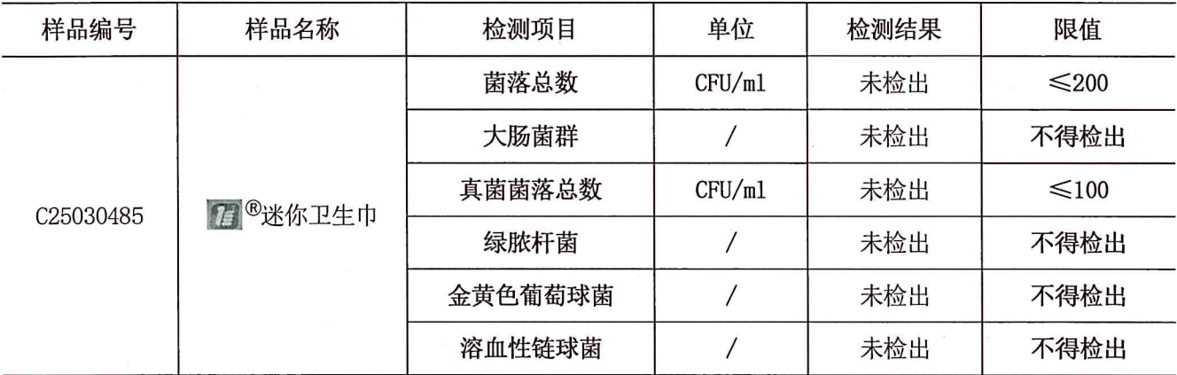
表 1 卫生用品检测结果一览表